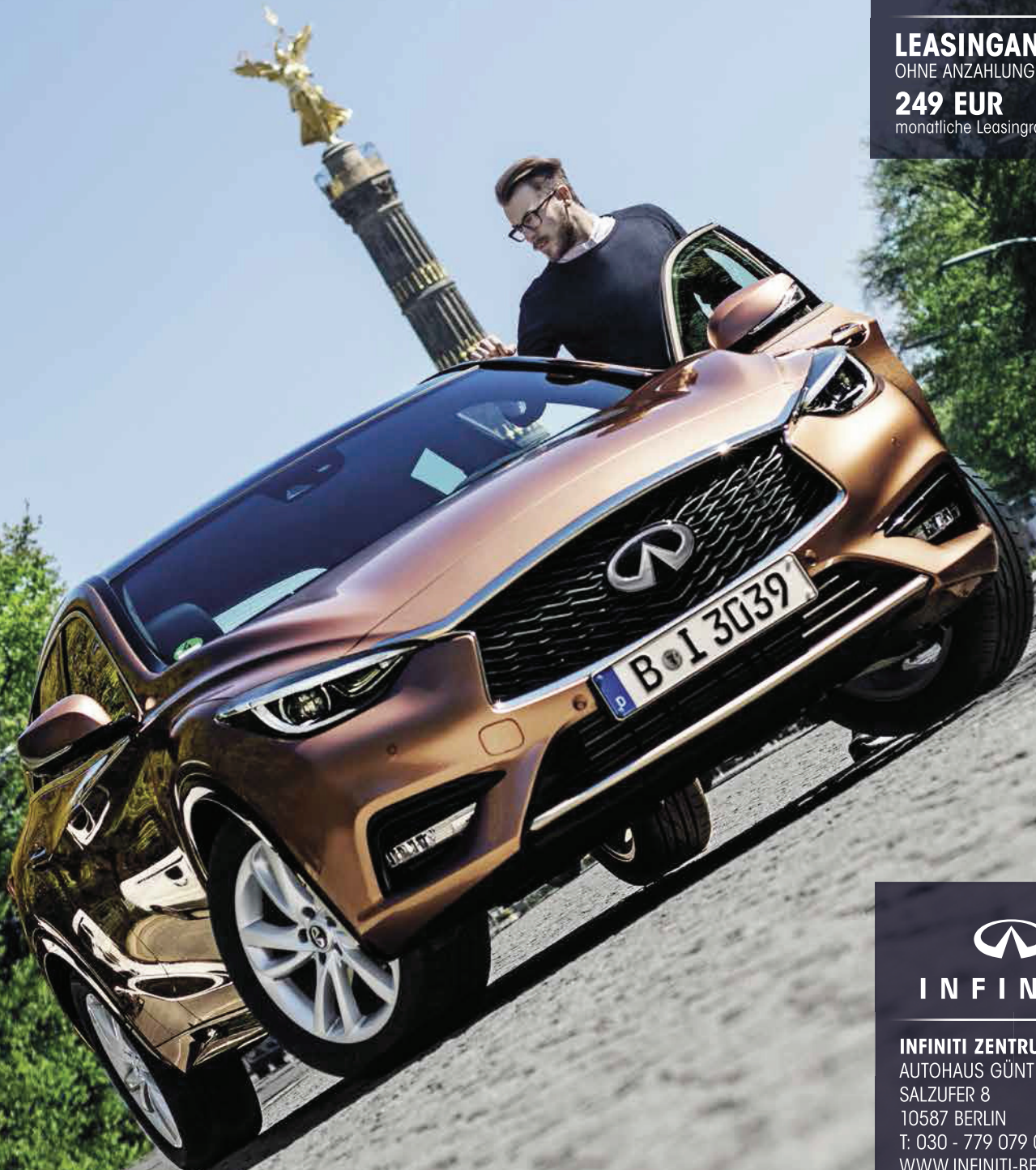
Abbildung zeigt Sonderausstattung.