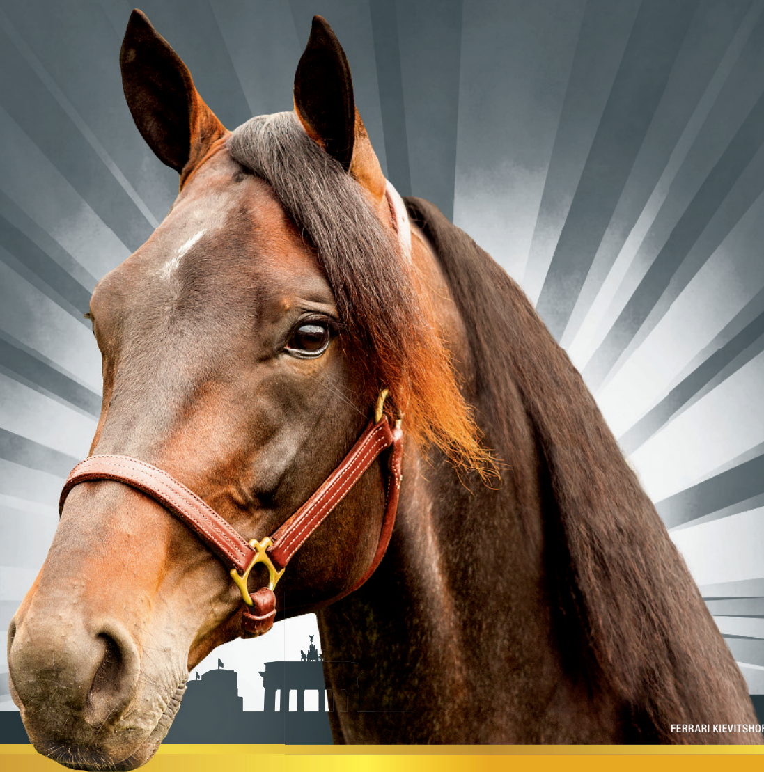
FERRARI KIEVITSHOF, DERBY-SIEGER 2015